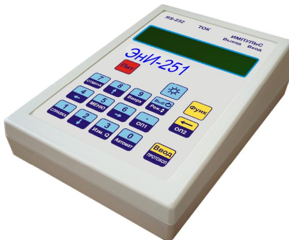
Рисунок 1 – Фотография общего вида

Схема пломбировки от несанкционированного доступа представлена на рисунке 2.