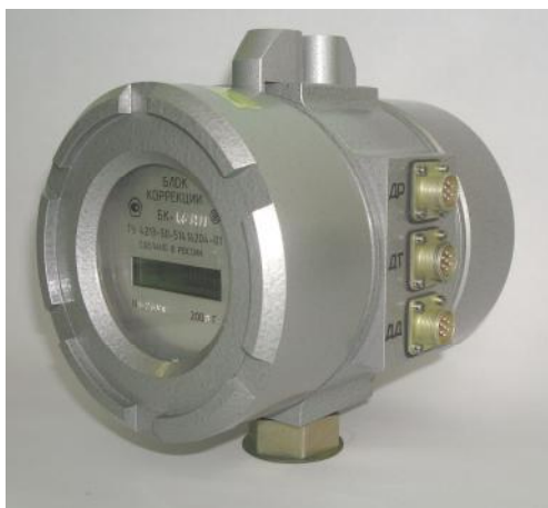
Рисунок 1 Общий вид блока коррекции объема газа измерительно-вычислительного БК

Вычислитель микропроцессорный представляет собой микроЭВМ, выполненную на базе современной микропроцессорной технологии, позволяющей производить с высокой точностью измерение требуемых параметров, проведение вычислений, а также хранение и вывод информации на внешние устройства.