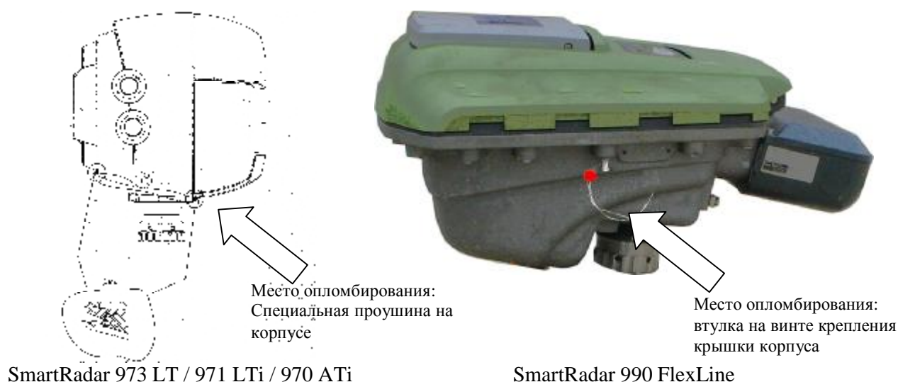
Рисунок 2 — Схема опломбирования

В модели SmartRadar 990 (FlexLine) результаты измерений отображаются на дисплее. Уровнемеры SmartRadar модели 970 ATi, 971 LTi, 973 LT могут быть дополнительно оснащены удаленными индикаторами (определяется заказом на поставку): резервуарным индикатором 977 TSI, полевым индикатором 877 FDI, панельным индикатором 878 CPI.