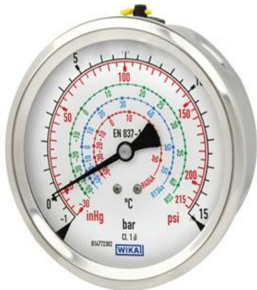
Рис. 2 Манометры деформационные с трубчатой пружиной 112.28, 113.28, 132.28, 133.28