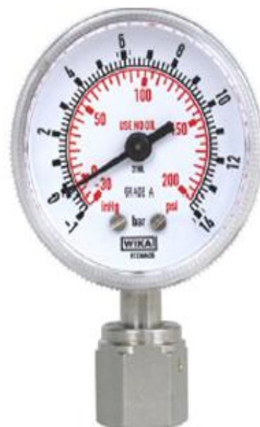
Рис. 5 Манометры деформационные с трубчатой пружиной 230.15