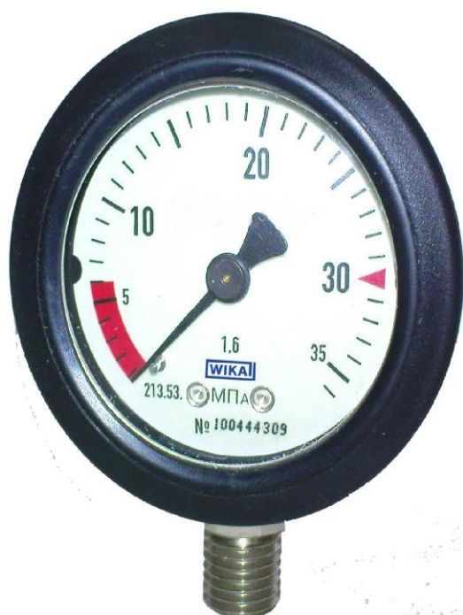
Рис. 6 Манометры деформационные с трубчатой пружиной 213.53 для пожарных дыхательных аппаратов