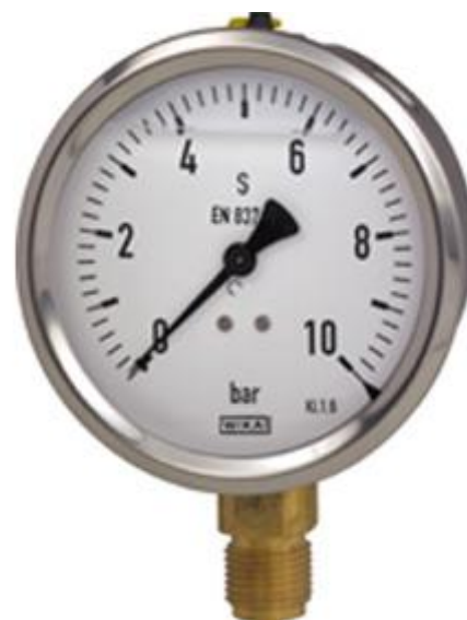
Рис. 3 Манометры деформационные с трубчатой пружиной 213.53 в стандартном исполнении