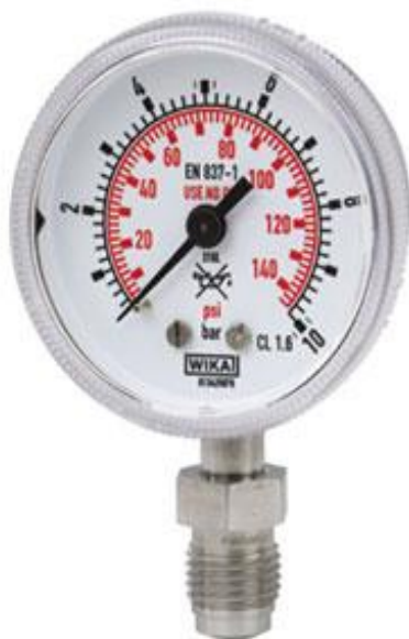
Рис. 4 Манометры деформационные с трубчатой пружиной 130.15