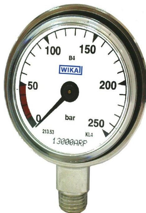
рис. 7 Манометры деформационные с трубчатой пружиной 213.53 для водолазных дыхательных аппаратов