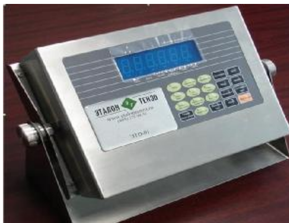
Рисунок 5 Внешний вид индикатора типа ЭТД-01