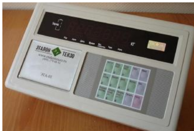
Рисунок 4 Внешний вид индикатора типа ЭТА-01