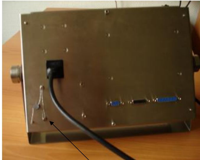
Место установки пломбы

Рисунок 2 Схема пломбировки от несанкционированного доступа и обозначение места для нанесения оттиска клейма на индикаторе типа ЭТД-01.