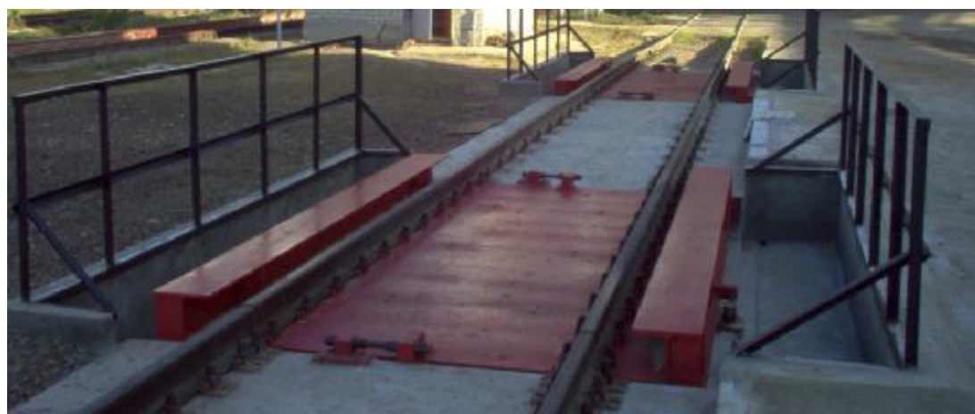
Рисунок 7 Весы стационарные электронные BC-150ВД-(МВ-150, ЭТА-01)