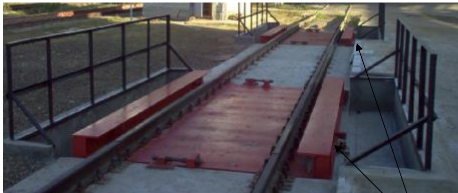
Рисунок 8 Маркировка весов стационарных электронных ВС-30А-(С16А, ЭТА-01)

ООО "НПО "Эталон Тензо" ВС-150ВД-(МВ-150,ЭТА-01) Max. 150 т Min. 1 т -30°С/+40°С e 50 кг №версии ПО: 00009.0 №10819 Сделано в России 2010 г.