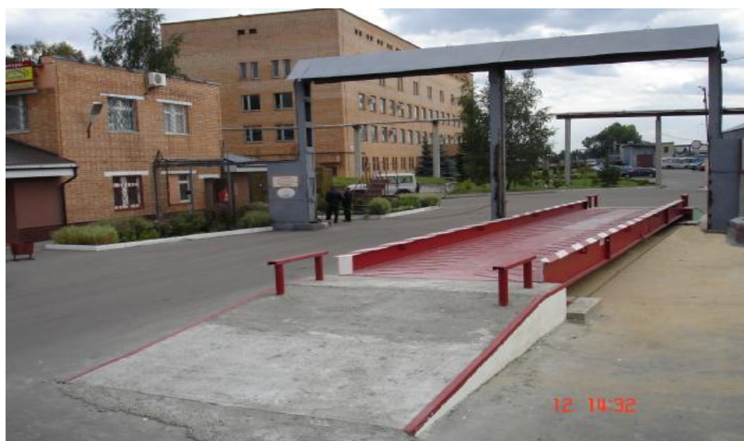
Рисунок 6 Весы стационарные электронные BC-30A-(C16A, ЭТА-01)