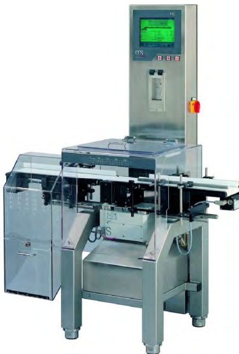
Рисунок 1 - Устройства весоизмерительные автоматические модификации НС.

Внешний вид устройств показан на рисунках 1 и 2.