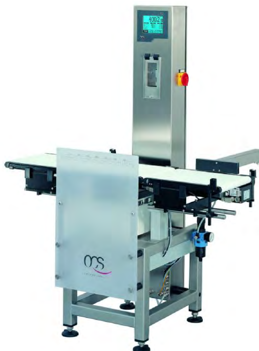
Рисунок 2 - Устройства весоизмерительные автоматические модификации ЕС/ЕС-М.

Принцип действия устройств основан на преобразовании силы тяжести взвешиваемого груза системой автоматического уравнивания с помощью датчика электромагнитной компенсации (моделей ЕС, IW-B или SW). Электрический сигнал, изменяющийся пропорционально массе взвешиваемого груза, преобразуется в цифровую форму при помощи АЦП, установленного внутри корпуса датчика. Результаты взвешивания выводятся на табло СПУ, на котором также размещена функциональная клавиатура. Информация о массе взвешиваемого груза отображается на СПУ и может быть передана на внешние электронные устройства с помощью следующих интерфейсов: RS232, RS422, RS485, 20мА, Ethernet, USB, по шине CAN, PROFIBUS, а также с помощью цифрового устройства ввода/вывода.