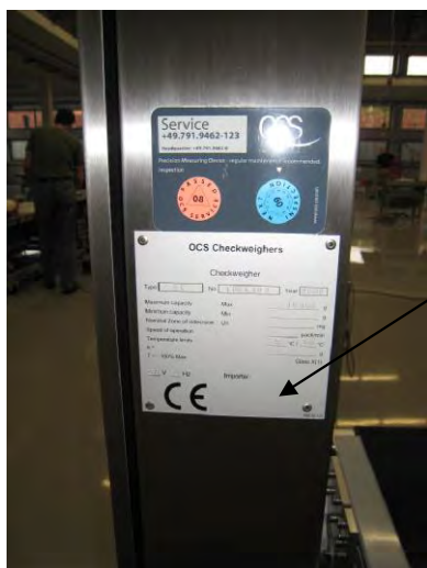
Место нанесения знака поверки

Устройства выпускаются в различных модификациях и исполнениях, отличающихся своими метрологическими и техническими характеристиками, а также набором дополнительных функций.