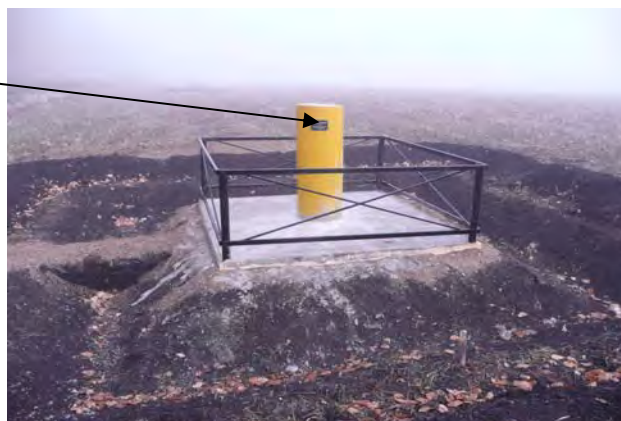
Рисунок 1 - Внешний вид пункта Базиса