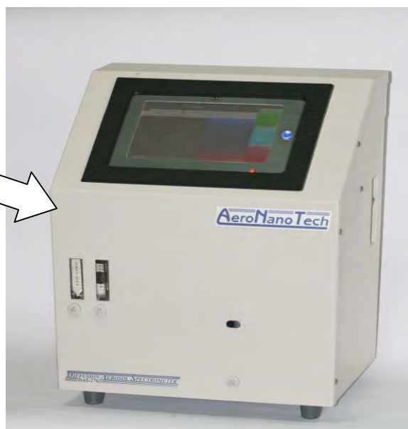
Рисунок 1- Внешний вид спектрометра и обозначение места для размещения знака утверждения типа