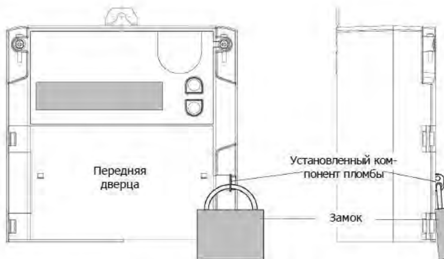
Схема пломбирования счетчика электрической энергии типа ZMD