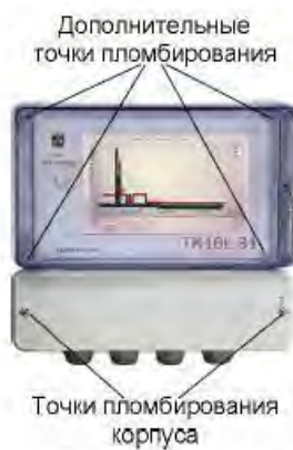
Схема пломбирования УСПД ТК16L.31