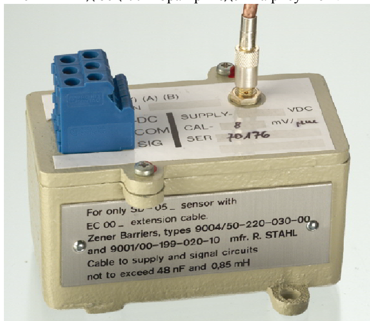
Рисунок 1 – Осциллятор OD-xxx

Внешний вид осциллятора приведен на рисунке 1.