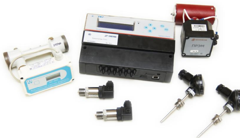
Рисунок 1 – Внешний вид теплосчетчика

Внешний вид теплосчетчика приведен на рисунке 1.