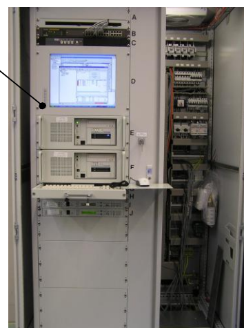
Рисунок 2 – Центральная станция