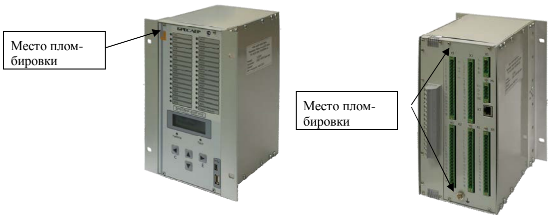
Рис.2 Место и пломбировки перминала серии «Бреслер-0107» на примере I конструктива.

Программное обеспечение обеспечивает взаимодействие между отдельными компонентами терминала, расчет измеряемых величин и вывод результатов измерений на дисплей и внешние интерфейсы. Терминал имеет встроенное программное обеспечение, размещенное специализированной микросхеме (ПЗУ с электрическим стиранием).