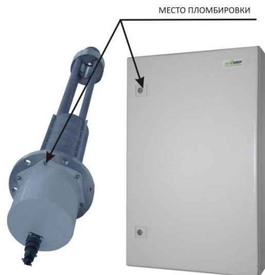
1 и 2 – места пломбировки Рисунок 3 - Схема пломбировки пылемеров