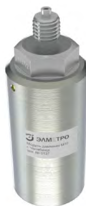
Калибратор давления портативный ЭЛМЕТРО-Паскаль-02