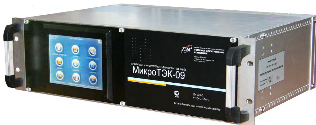
Рисунок 1 – Общий вид МикроТЭК-09