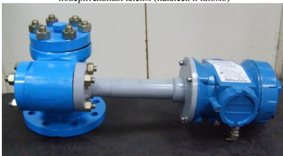
Рисунок 1. Внешний вид датчика уровня (без буйка)

Фотографии внешнего вида датчика уровня и места нанесения поверительных клейм (наклеек и пломб)