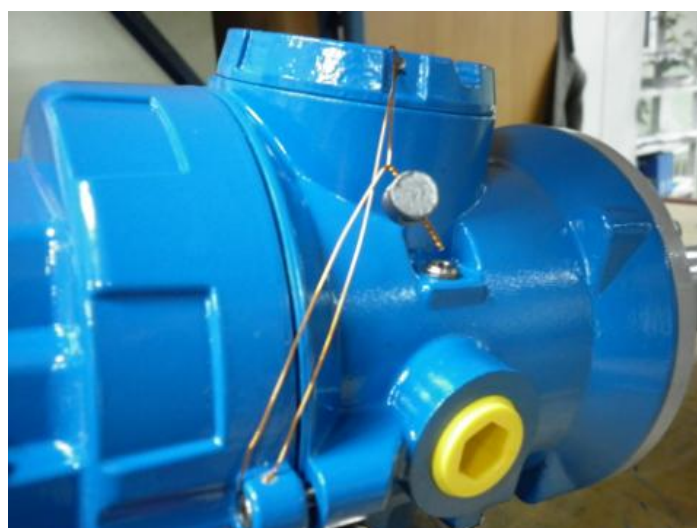
Рисунок 2. Места нанесения поверительных клейм (наклеек и пломб)