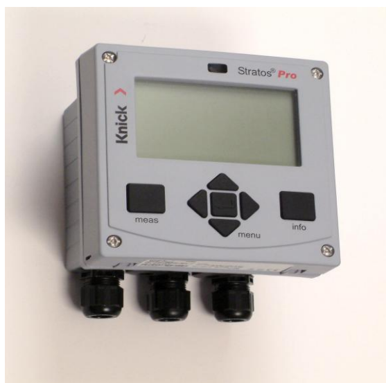
Общий вид анализатора