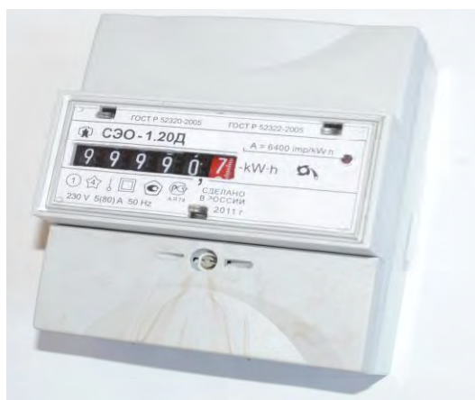
Рисунок 1 – Внешний вид счетчика СЭО-1.20Д