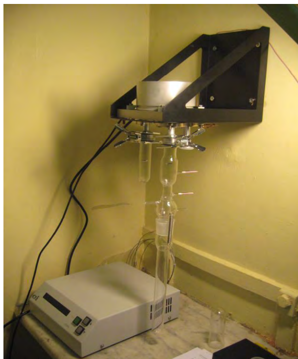
Рисунок 2 – Общий вид весов