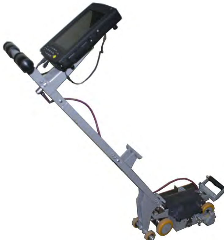
Рисунок 1 – Вид прибора ИНТРОКОР

Фотография прибора представлена на рисунке 1.