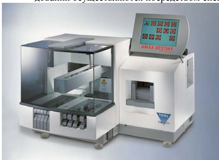
Рисунок 1 - Анализатор – коагулометр Destiny Plus

Настройка анализаторов, оптимизация их параметров, управление работой, обработка выходной информации, запоминание результатов анализа и контроль качества исследований осуществляются посредством специальных программ.