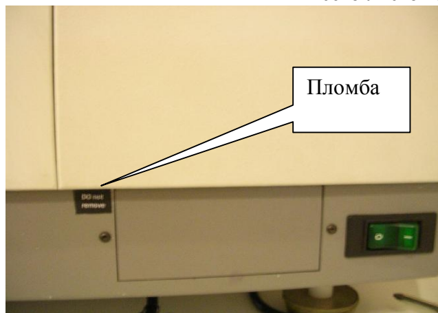
Рисунок 4 - Анализатор - коагулометр Destiny Max. Расположение пломбы.