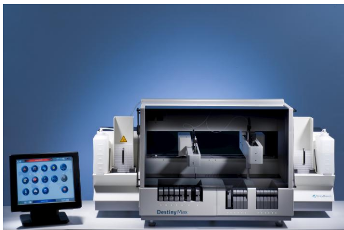
Рисунок 3 - Анализатор -коагулометр Destiny Max