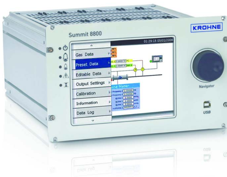
Рисунок 1 - Внешний вид контроллера (вид спереди).

Контроллер снабжается цветным графическим сенсорным дисплеем, который позволяет отображать и редактировать данные. От несанкционированного изменения данные и программное обеспечение защищены системой паролей с различным уровнем доступа и с помощью аппаратных пломбируемых переключателей.