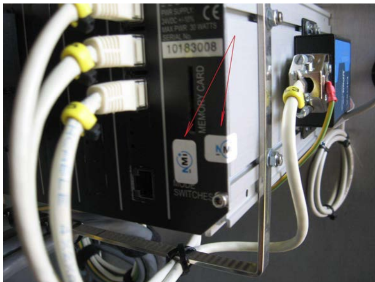
Рисунок 3 - Пломбирование аппаратных переключателей и крепления задней панели.

Доступ к несанкционированной загрузке и обновлению программного обеспечения ограничен аппаратными переключателями. Аппаратные переключатели подлежат пломбированию для предотвращения несанкционированного доступа (см. Рис. 3,4).