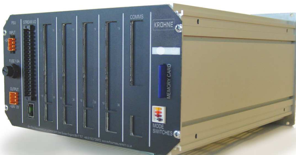
Рисунок 2 - Внешний вид контроллера (вид сзади)

Контроллер может использовать в качестве входных величин как величины получаемые от измерительных преобразователей (данные о расходе, давлении, температуре, относительной плотности, составе газа и др.), так и величины задаваемые вручную. Входные величины могут так же передаваться в контроллер периодически от системы более высокого уровня.