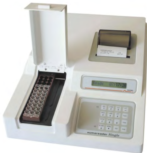
HUMAREADER SINGLE PLUS

Анализаторы иммуноферментные HUMAREADER модификаций HUMAREADER SINGLE PLUS, HUMAREADER HS представляют собой (рисунок 1) одноканальные вертикальные фотометры с многопозиционной поворотной оправкой для светофильтров в которую установлено 4 светофильтра, выделяющие рабочие длины волн. В качестве источника света использована лампа накаливания. Световой поток источника света последовательно проходит через оптическую систему с автоматически устанавливающимися фильтрами, исследуемый образец и поступает на детектор. Детектор преобразует падающий свет в электрический сигнал, который затем усиливается и обрабатывается. Для выполнения измерений могут применяться отдельные 12-ти или 8-ми луночные стрипы для HUMAREADER SINGLE PLUS и стандартные микропланшеты (до 96-ти исследуемых образцов) для HUMAREADER HS. Измерение образцов, а также обработка результатов производится в автоматическом режиме с выводом результатов измерений на встроенный дисплей и принтер (для HUMAREADER SINGLE PLUS).