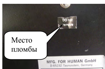
HUMAREADER SINGLE PLUS

Уровень защиты программного обеспечения от непреднамеренных и преднамеренных изменений по МИ 3286-2010: С - Метрологически значимая часть ПО СИ и измеренные данные достаточно защищены с помощью специальных средств защиты. Конструктивно анализаторы имеют защиту встроенного программного обеспечения от преднамеренных или непреднамеренных изменений, реализованную изготовителем на этапе производства путем установки системы защиты микроконтроллера от чтения и записи. Также конструкцией анализаторов предусмотрена пломбировка корпуса прибора в метлах установки винтовых соединений (Рисунок 2).