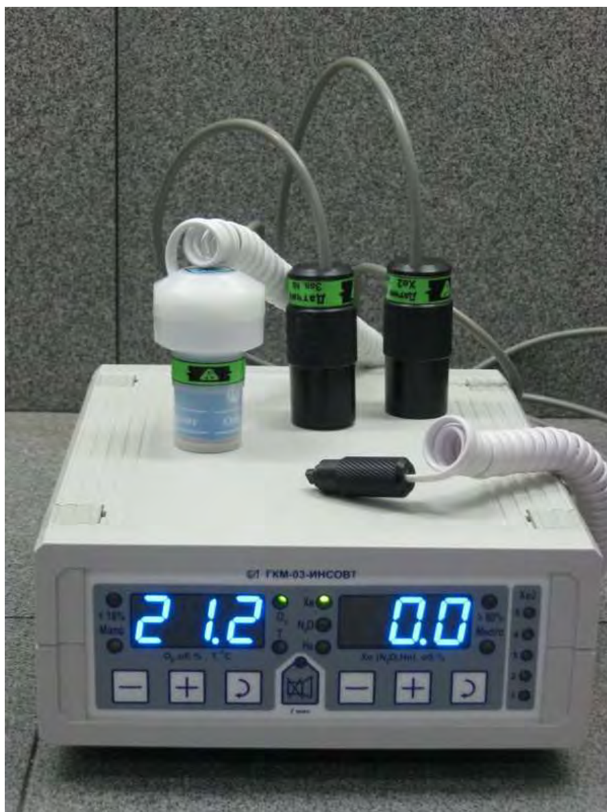
Рисунок 1 - Общий вид газоанализатора