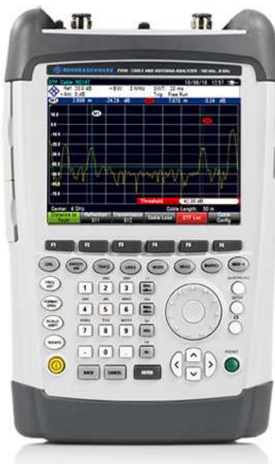
Внешний вид прибора

Знак утверждения типа, знак поверки, инвентарные и калибровочные наклейки наносятся на заднюю панель анализаторов кабельных трактов и антенн R&S ZVN4, R&S ZVN8.