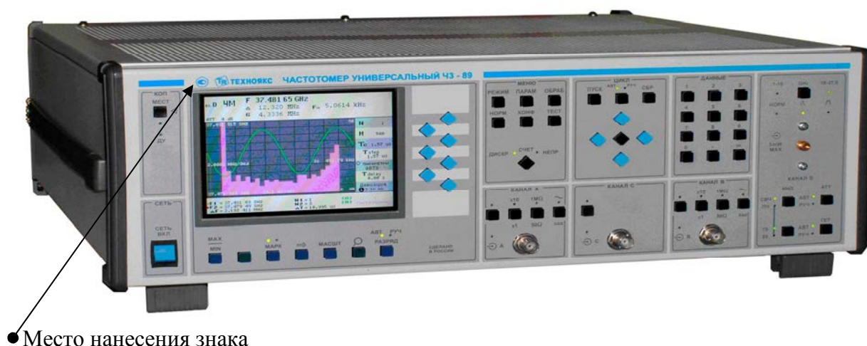
Рисунок 1 – Общий вид частотомера

Схема пломбировки частотомера универсального ЧЗ-89 приведена на рисунке 2.