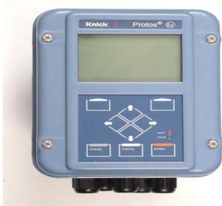
Рис.1. Анализатор Protos ® 3400 **/* . Общий вид.

В конструкции составных анализатора предусмотрено опломбирование, ограничивающее несанкционированный доступ к внутренним частям в период эксплуатации (см.рис.2).