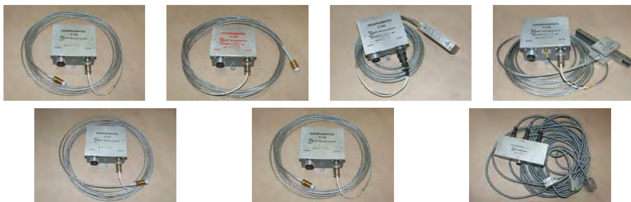
Рисунок 4 - Преобразователи с датчиками.

Датчики устанавливаются непосредственно на объекте контроля, нормирующие преобразователи – в непосредственной близости от объекта контроля на фундаменте или раме турбоагрегата и соединяются посредством кабельных связей с блоками контроля.