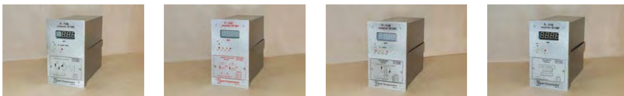
Рисунок 2 - Блоки контроля

Блоки контроля представляют собой закрытый корпус. На лицевой панели расположены цифровые или графические индикаторы и органы управления прибора, закрытые крышкой (лючком). На задней панели расположены разъемы для присоединения к внешним цепям и пломбируемые винты крепления боковой крышки (Рисунок 3).