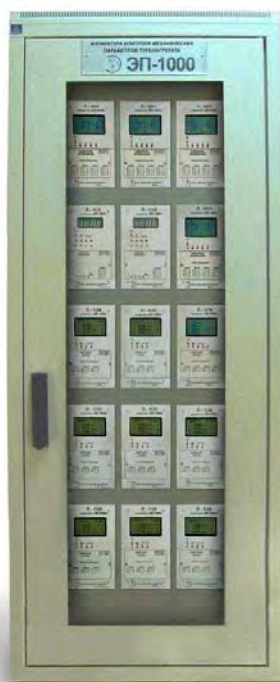
Рисунок 1 - Аппаратура контроля механических параметров турбоагрегатов ЭП-1000

Аппаратура выпускается в виде отдельных блоков, содержащих один, два, три или четыре измерительных канала (рисунок 2), либо в виде измерительного комплекса – блоки контроля устанавливаются в шкафы «Евромеханика» (рисунок 1).