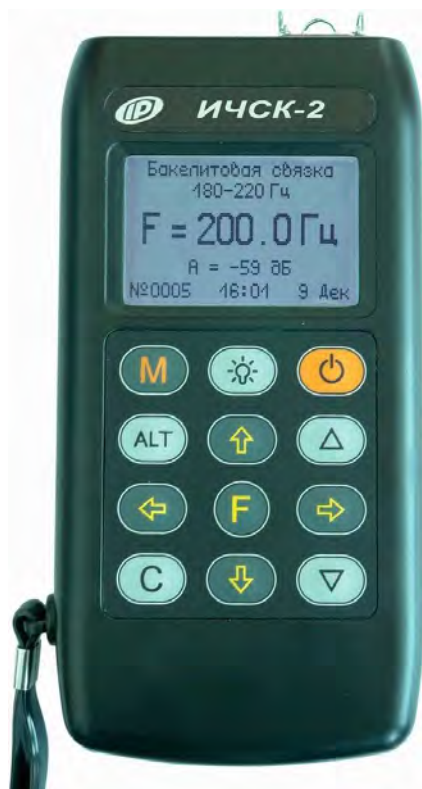
Рисунок 1 – Общий вид измерителя частот собственных колебаний ИЧСК-2

Место пломбирования от несанкционированного доступа расположено в батарейном отсеке электронного блока на винте крепления корпуса. Это место одновременно является местом нанесения отиска клейма при поверке.