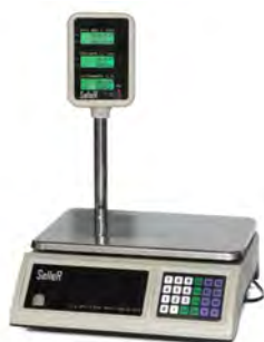
Рисунок 1 - Seller SL 201P15 LCD