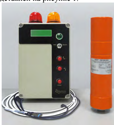
Рисунок 1 – Установка дозиметрическая для измерения мощности амбиентного эквивалента дозы гамма-излучения УДМГ-102.

Внешний вид установки представлен на рисунке 1.