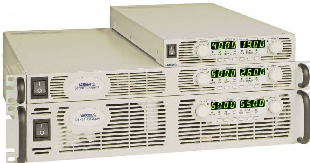
Рисунок 1 – Фотография общего вида

Защита ПО от непреднамеренных и преднамеренных изменений соответствует уровню «А» по МИ 3286-2010.