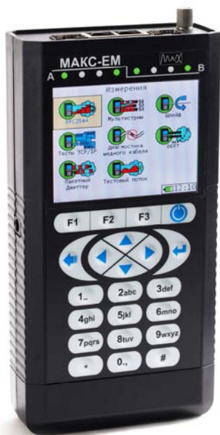
Рисунок 1- Общий вид тестера

Общий вид тестера и схема пломбировки от несанкционированного доступа (Н1 и Н2 пломбы, выполненные из однократно наклеиваемой ленты с уникальным изображением), представлены на рисунках 1 и 2 соответственно.