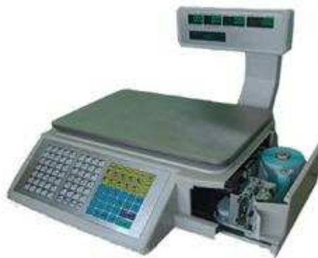
Рисунок 1 – Общий вид весов электронных CheckWay Scale 315

Маркировка весов состоит из трех цифр: индекс исполнения, затем индекс модификации по максимальной нагрузке.