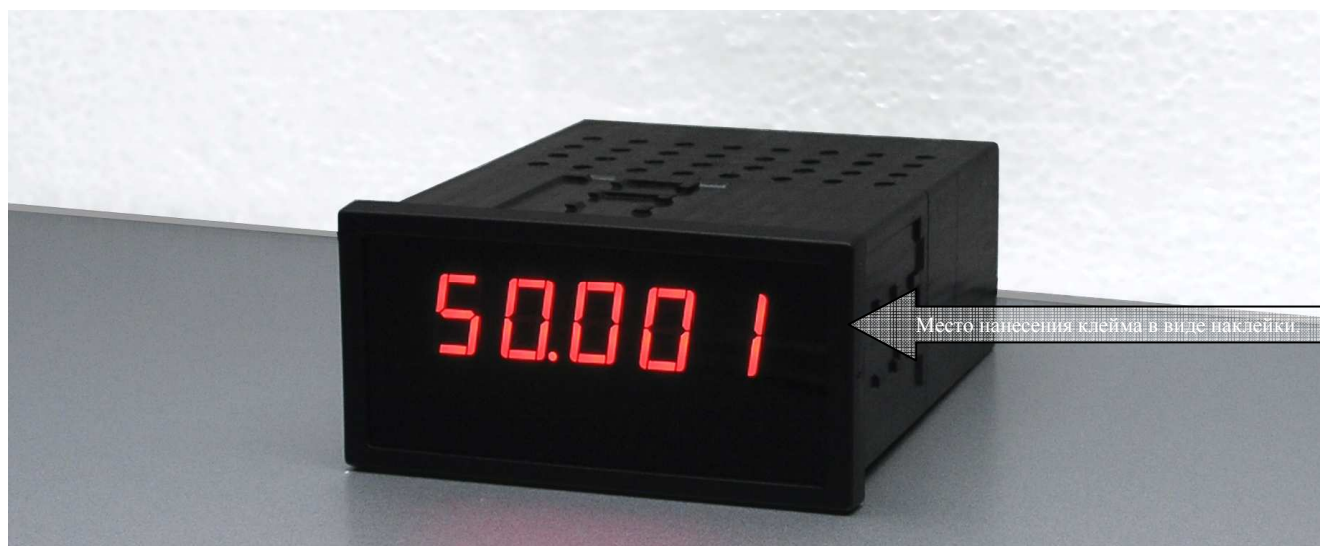
Рисунок 1 - Фотография общего вида

Место пломбировки не предусмотрено конструкцией корпуса, пломбирование производится наклеиванием поверительного клейма в виде наклейки на место разъема корпуса.