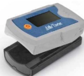
Рис. 2 Исполнение MD300C33.