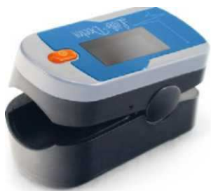
Рис. 1 Исполнение MD300C21C

Пульсоксиметры напалечные MD300C мод. MD300C21C, MD300C33 производят измерения по пальцу руки. В нижней части пульсоксиметра встроены два светодиода, попеременно излучающие свет в красной и инфракрасной областях спектра. В верхней части находится сенсор с фоточувствительным элементом, регистрирующий прошедшее через палец излучение. По анализу поглощения излучения с красной и инфракрасной длинами волн вычисляется значение сатурации. Значение частоты пульса получают посредством анализа пульсовой волны, характеризующей частоту сердечных сокращений во времени. Результаты анализа выводятся на дисплей в виде значений уровня сатурации и частоты пульса. На верхней панели пульсоксиметра находится кнопка включения, после повторного нажатия которой переключаются режимы просмотра дисплея во время измерения. При продолжительном (более одной секунды) нажатии кнопки включения яркость дисплея изменяется, предусмотрено 10 уровней яркости. В исполнении MD300C33 имеется автоматическая звуковая и визуальная сигнализация при выходе за пределы значений сатурации и частоты пульса, установленных производителем (сигнализация включается при сатурации менее 90 процентов и при частоте пульса менее 60 или более 100 ударов в минуту). Питание осуществляется от внутренних элементов питания. Пульсоксиметры напалечные MD300C мод. MD300C21C, MD300C33 различаются формой, цветом и элементами оформления корпуса.