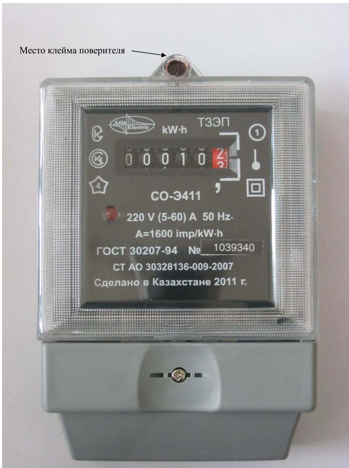
Фото с указанием места клейма поверителя.