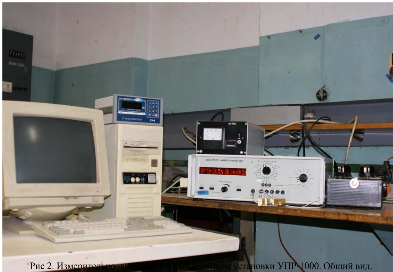
Рис 2. Измеритель по-вн... в комплексе установки УПР-1000. Общий вид.