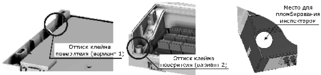
Рисунок 3 – Места пломбирования тепловычислителя