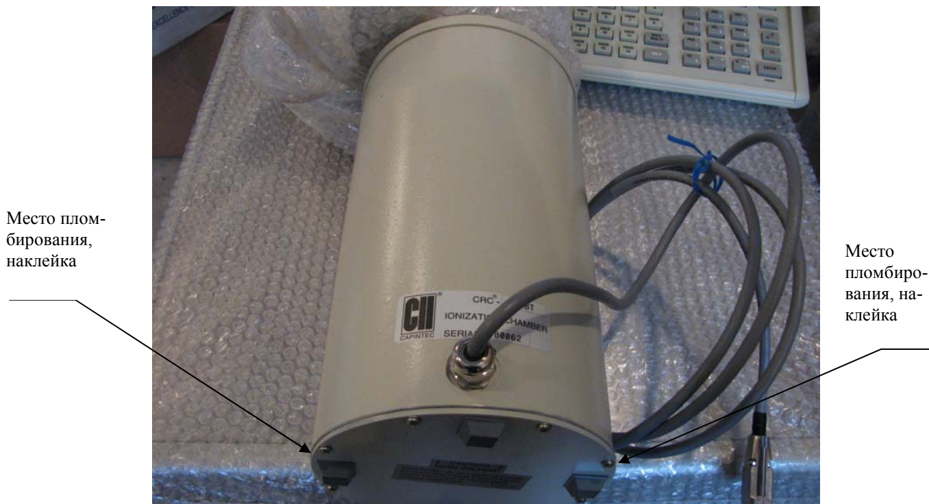
Рисунок 2 — Места пломбирования ионизационной камеры от несанкционированного доступа