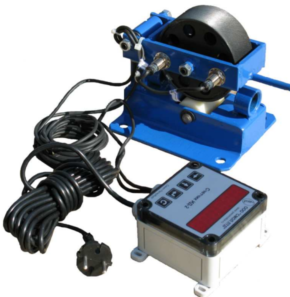
Рисунок 1 - Внешний вид измерителя длины материалов модели ИДМ-20

Измерители состоят из механического и электронного блоков. Механический блок представляет собой основание с подъемной рамой. На основании установлен опорный ролик и расположены входное и выходное окна измерителей с направляющими роликами (кроме модели ИДМ-20). На подъемной раме расположен измерительный ролик; здесь же крепятся два индуктивных датчика электронного блока. Электронный блок, в качестве которого используется счетчик ИД-2, выполняет преобразование сигналов индуктивных датчиков в значение длины измеряемого материала; кроме того, электронный блок выдает звуковой сигнал при достижении заданной длины материала. Измерение длины материала производится путем протягивания материала между опорным и измерительным роликами. Длина материала, пропорциональная количеству оборотов измерительного ролика, регистрируется на цифровом табло электронного блока. Конструкция измерителей обеспечивает реверсивный счет, что исключает ошибку измерения, обусловленную изменением направления движения материала. Внешний вид измерителей представлен на рис. 1-5.