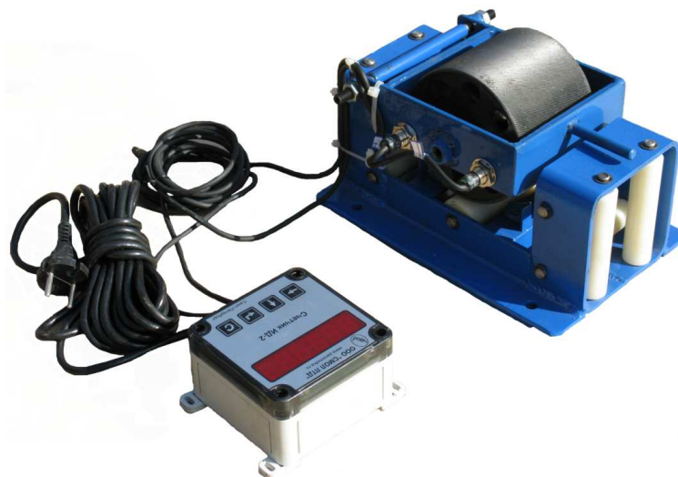
Рисунок 2 - Внешний вид измерителя длины материалов модели ИДМ-30