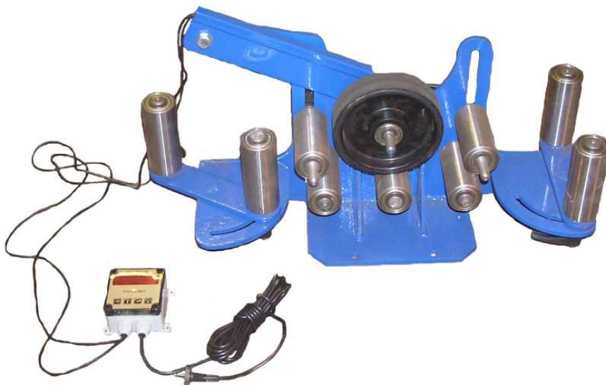
Рисунок 5 - Внешний вид измерителя длины материалов модели ИДМ-120

Модели измерителей отличаются диаметрами измеряемых материалов. Измерители модели ИДМ-65ПВР также отличаются от измерителей модели ИДМ-65ПВР возможностью регулировки вертикальных направляющих роликов.