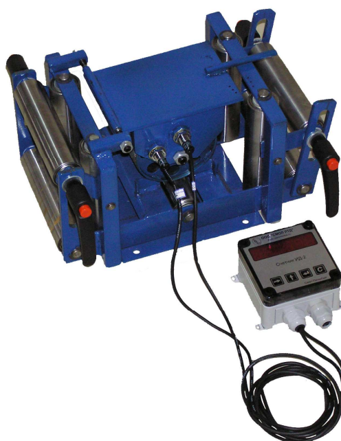
Рисунок 4 - Внешний вид измерителя длины материалов модели ИДМ-65ПВР