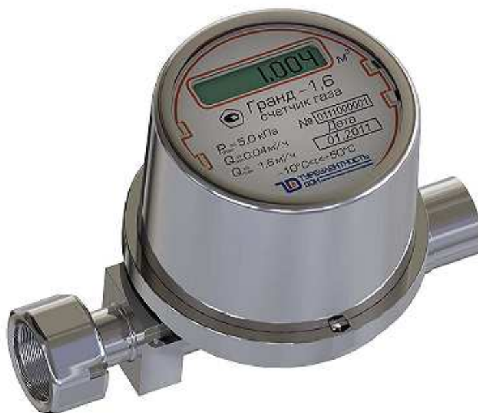
Фото 1. Общий вид счетчика газа Гранд.

На фото 1 приведен общий вид счетчика газа Гранд.