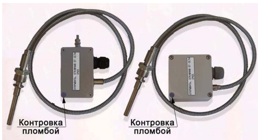
Погружаемые термопреобразователи с соединительным кабелем с видом взрывозащиты «Искробезопасная электрическая цепь» по ГОСТ Р 51330.10-99