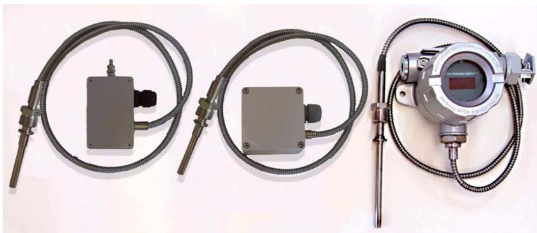
Погружаемые общепромышленные термопреобразователи с соединительным кабелем, в том числе с ЦД