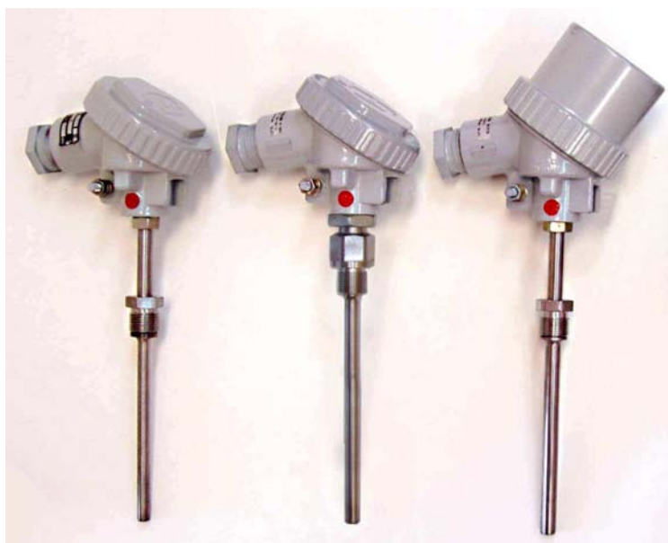
Погружаемые общепромышленные термопреобразователи, в том числе с ЦД