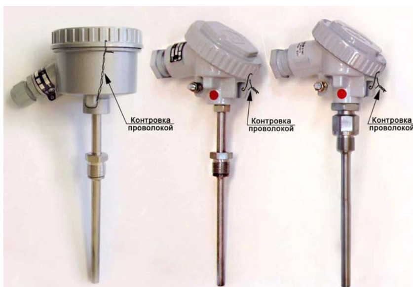
Погружаемые термопреобразователи с видом взрывозащиты «Искробезопасная электрическая цепь» по ГОСТ Р 51330.10-99