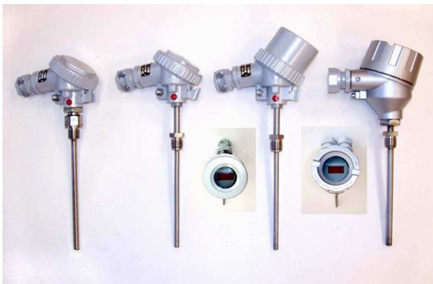
Погружаемые термопреобразователи с видом взрывозащиты «Взрывонепроницаемая оболочка» по ГОСТ Р 51330.1-99, в том числе с ЦД