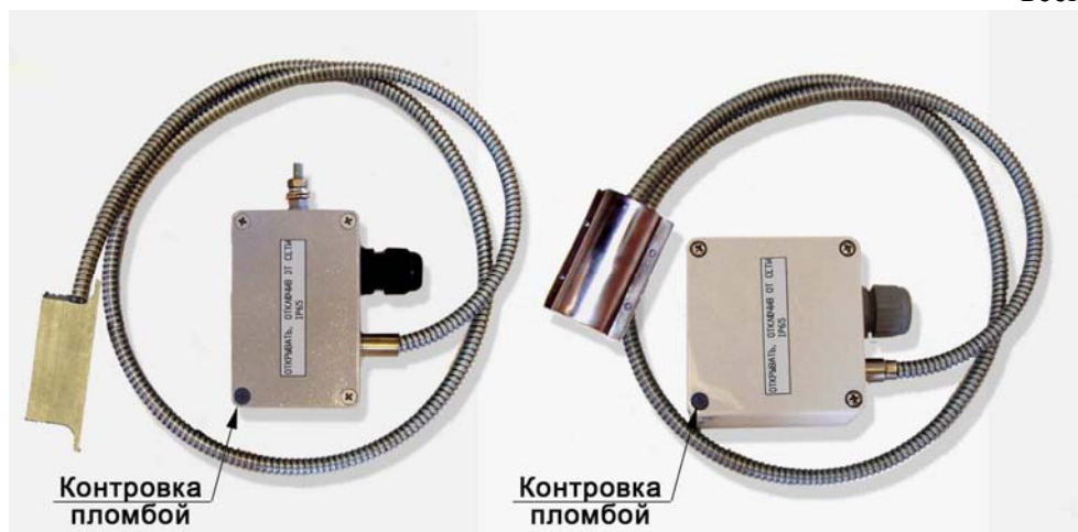
Поверхностные термопреобразователи с видом взрывозащиты «Искробезопасная электрическая цепь» по ГОСТ Р 51330.10-99