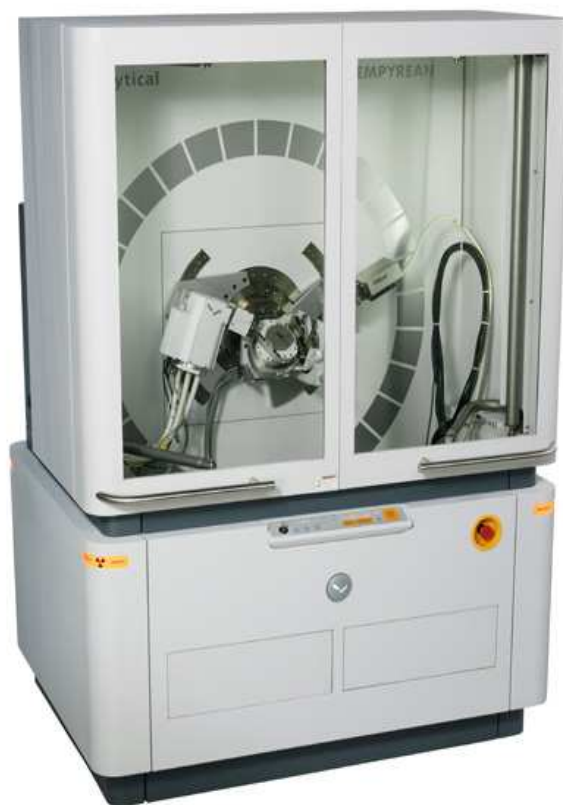
Рис.1 Дифрактометр рентгеновский Empyrean

Внешний вид дифрактометра приведен на рисунке 1.