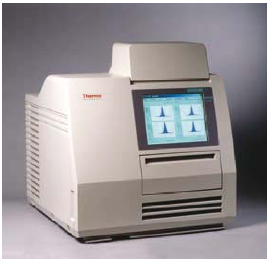
Рис. 1 – Фотография общего вида системы ТЛД Harshaw 6600 LITE.

Программное обеспечение WinREMS позволяет осуществлять калибровку считывающего устройства и дозиметров с использованием различных дозиметрических единиц измерений (Рентген, Грей, рад, бэр, Зиверт). Расчет индивидуальных доз в смешанных полях гамма, бета и нейтронного излучения производится с помощью программного обеспечения 8806 N DOELAP и 8805 BGN DOELAP.