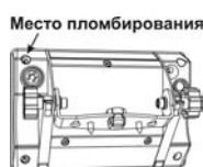
Место пломбирования весов Штрих МП (исполнения Ф1, Ф2, Ф3)

Идентификация и защита метрологически значимой части встроенного программного обеспечения (ПО) весов производится с помощью отображаемого при включении весов значения версии ПО и контрольного числа, а также пломбирования весов. Место пломбирования – пломбировочная чашка на задней крышке терминала.