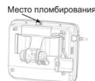
Место пломбирования весов Штрих МП (исполнение Ф4)

Программное обеспечение весов выполняется на базе микроконтроллера и жестко привязано к их электрической схеме. Микроконтроллер программируется через специальный разъём, доступ к которому не возможен без нарушения пломбы. Программное обеспечение состоит из модулей (подпрограмм) обслуживания периферии, расчета веса и взаимодействия с пользователем. Модуль обслуживания периферии производит опрос клавиатуры, вывод на дисплей, контролирует питание весов, опрашивает АЦП, управляет обменом данными по последовательному порту, хранит и загружает из энергонезависимой памяти градуировочные константы и настройки. Модуль расчета веса получает от модуля обслуживания периферии значение АЦП и значения градуировочных констант и производит расчет веса, отслеживает динамику его изменения и контролирует, чтобы он не вышел за границы допустимых значений. Модуль взаимодействия с пользователем подготавливает к выводу на дисплей в символьном виде данные, полученные им от модулей расчета веса и обслуживания периферии. Также, он обрабатывает данные о нажатых клавишах и выдает соответствующие команды модулю взвешивания, после чего производит анализ результатов выполнения этих команд и выдачу их пользователю.