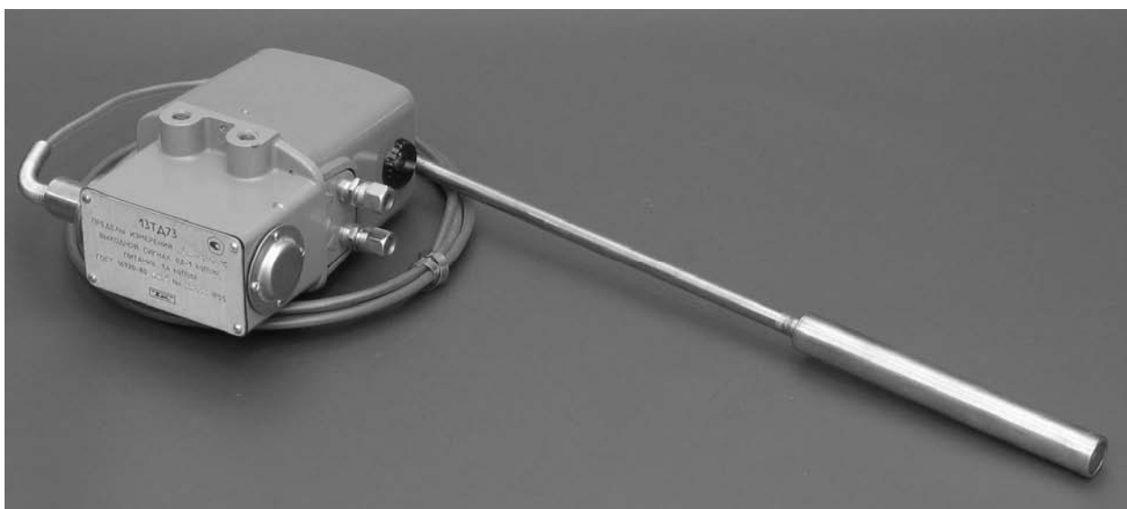
Фото общего вида преобразователей

Принцип действия преобразователей основан на силовой компенсации. Изменение температуры контролируемой среды воспринимается заполнителем термосистемы через термобаллон и преобразовывается в изменение давления, воспринимаемое сильфоном, который герметически связан с термобаллоном через соединительный капилляр. Приращение силы на штоке сильфона, пропорциональное приращению температуры, передается на рычаг пневмосилового преобразователя. Под действием созданного усилия рычаг поворачивается на незначительный угол и перемещает заслонку индикатора рассогласования, питаемого сжатым воздухом. Возникающий в линии сопла сигнал управляет давлением, поступающим из пневмореле в сильфон обратной связи и в линию выхода.