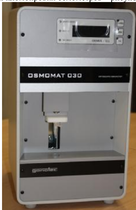
Рисунок 1 – Общий вид осмометров OSMOMAT модель 030

Схема маркировки и пломбировки осмометров – рисунок 2.