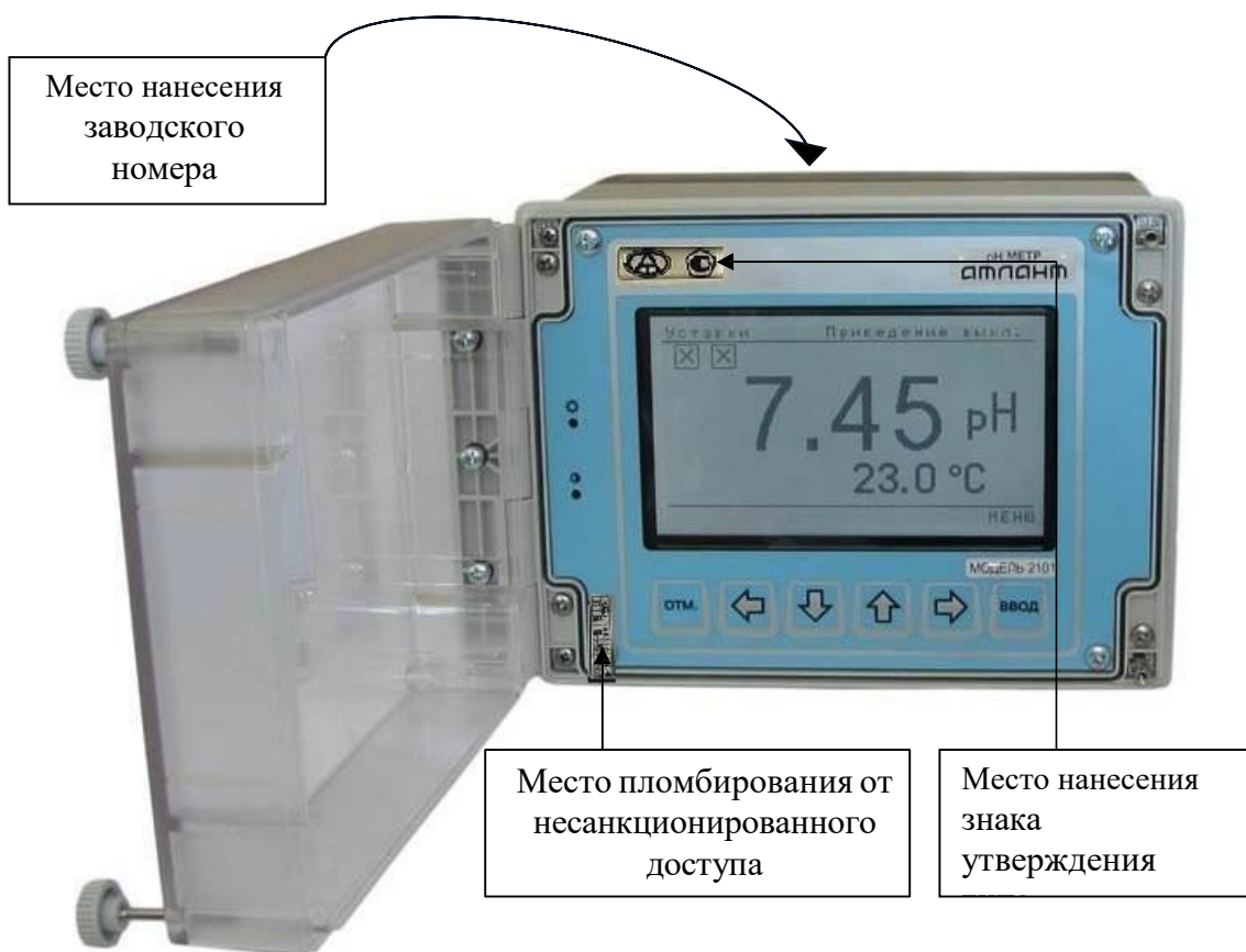
Рисунок 1 - Внешний вид pH-метров, место нанесения знака утверждения типа, заводского номера, а также схема пломбовки от несанкционированного доступа